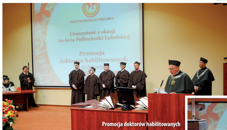
Promocja doktorów habilitowanych