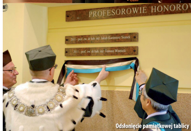
Odsłonięcie pamiątkowej tablicy