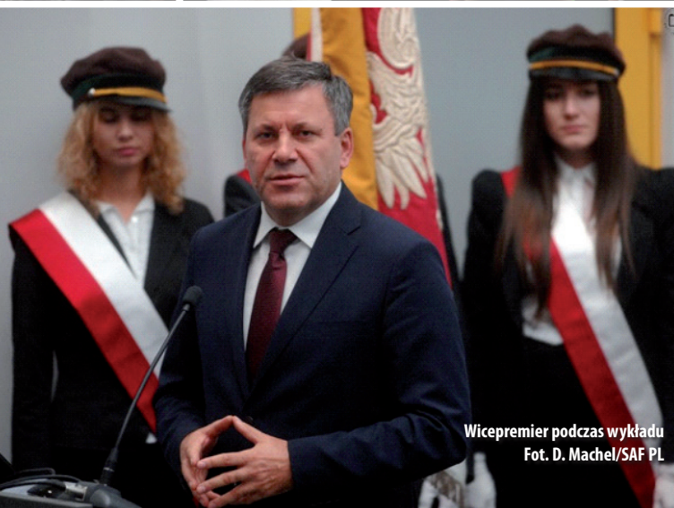
Wicepremier podczas wykładu