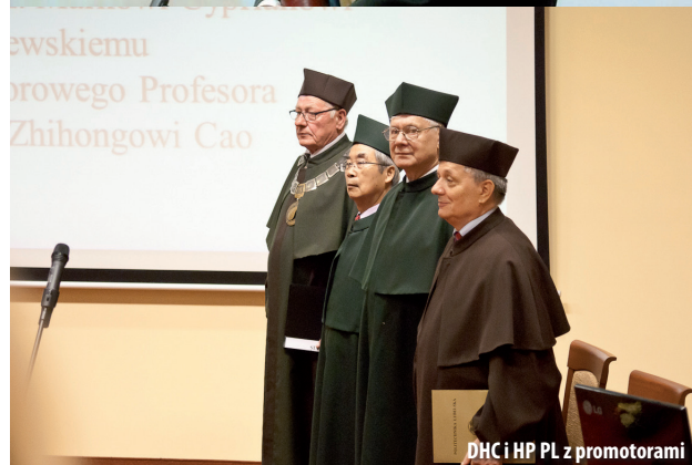
DHC i HP PL z promotorami