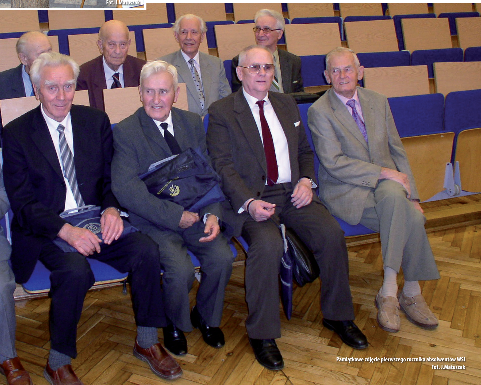
Pamiątkowe zdjęcie pierwszego rocznika absolwentów WSI