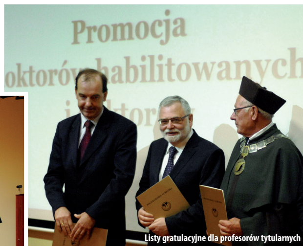
Listy gratulacyjne dla profesorów tytularnych