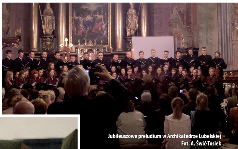
Jubileuszowe preludium w Archikatedrze Lubelskiej