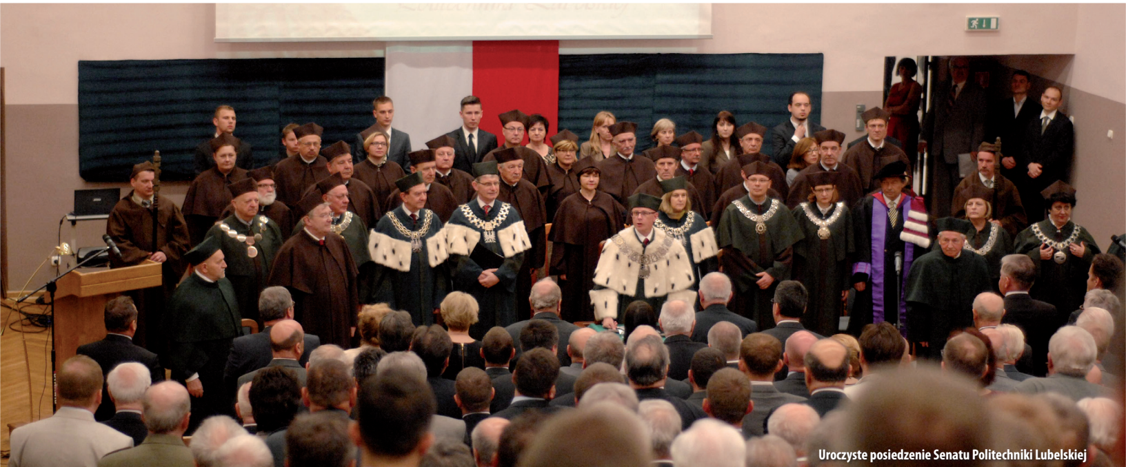
Uroczyste posiedzenie Senatu Politechniki Lubelskiej