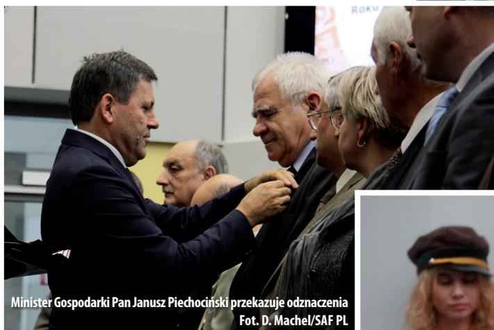
Minister Gospodarki Pan Janusz Piechociński przekazuje odznaczenia